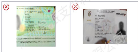
证件不完整（缺边角）