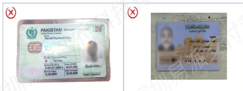
身份证件图片曝光